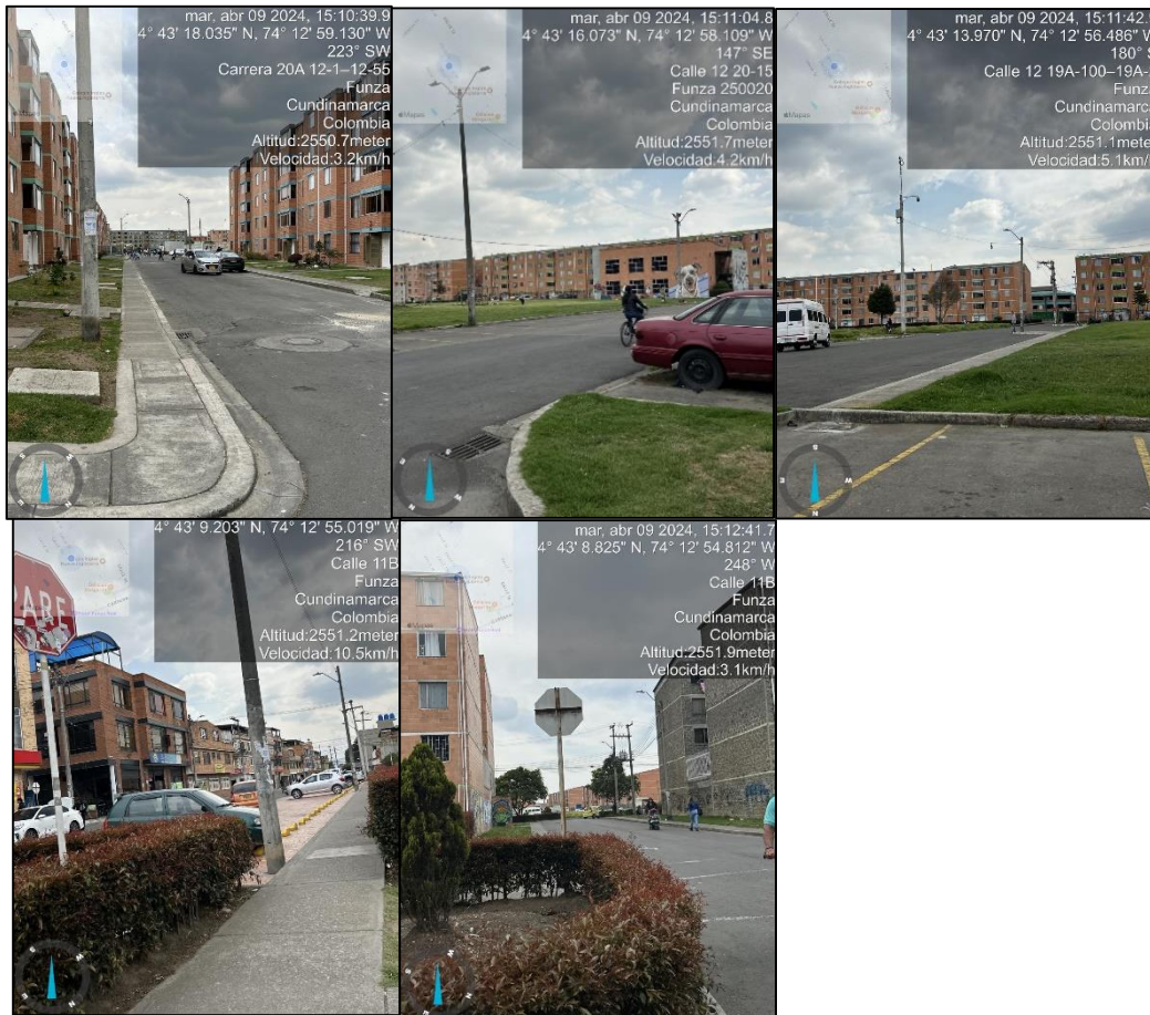
Ilustración 2. Evidencias recorrido

C.P. 250020 Tel. +57(1) 823 40 70 823 40 71 / 823 40 73 Fax. +57(1) 825 76 20 Dir. Cra. 14 No. 13-05